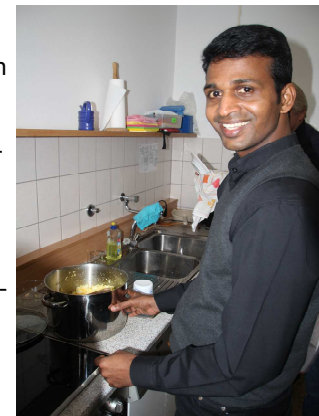
Kolpingsfamilie, B. Viermann

Ingwer, Kardamom, Curry, Knoblauch, Kurkuma, Kokos und indisch Marsala dufteten durch die Räume des Paulinums und verliehen den Speisen intensive Farben. Die Aufgaben wurden verteilt und viele Hände schnippelten Möhren, Kraut, Hähnchenfleisch und Obstsalat. Pater George hatte am Abend zuvor bereits die Hauptspeise – Lachs in Tomatensauce – nach dem Rezept seiner Mutter vorbereitet. Zwischen all den Töpfen und Pfannen beantwortete er geduldig lächelnd die vielen Fragen nach seiner Heimat. Die Rezepte und Gewürzmischungen allerdings blieben sein Geheimnis.